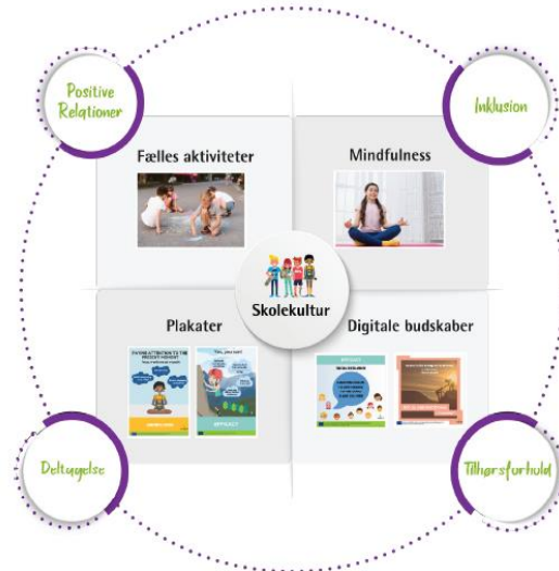
Figur 3. TRIVSEL FOR ALLE programmet består af 4 moduler af valgfrie aktiviteter, der fremmer et robust skolemiljø og en kultur for mental trivsel i skolen.

I denne helskoletilgang inviteres personalet, alle elever, familier og lokale institutioner til at deltage i programmet.