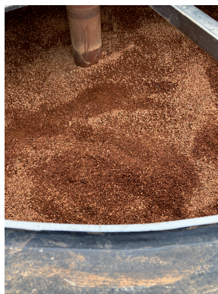
Figur 3: DiaPure filtermateriale.

I et testfiltersystem ved Fensholt modtager filteret drænvand fra ca. 25 ha markareal i typisk kornsædskifte.