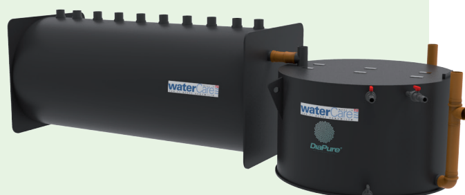
Figur 1: Principskitse af filtersystemet, som testes på leret drænet højbundsjord i Østjylland ved Fensholt. Tegning: WaterCare Aps.

Anvendelsen af kompakte fosforfiltre på dræned højbundsjord kan dog være en fremtidig løsning i de områder, hvor vandet har et højt indhold af partikulært fosfor. Her er fosfor hovedsageligt bundet til ler- og siltpartikler som transporteres i drænene. Kompakte filtersystemer målrettet højbundsjord er i dag designet til særligt at håndtere partikulært bundet fosfor, og består af et dobbeltporøst partikelfilter (DPF) og et sorbent-filter med DiaPure-materiale – se detaljer for disse filterenheder herunder. Fosforfilteret er designet til at håndtere både partikulært fosfor og vandopløseligt fosfor, men det forventes at partikulært fosfor vil udgøre den største andel af fosforudvaskningen. (Heckrath et al., 2025).